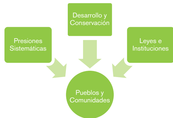
Figura 1: Los pueblos indígenas y tribales y las comunidades locales se ven directamente afectados por a) presiones sistemáticas, b) desarrollo y conservación, así como c) leyes y políticas que socavan su resiliencia a estas perturbaciones.

y las instituciones tradicionales y los derechos consuetudinarios a sus territorios, tierras, aguas, recursos naturales y sistemas de conocimiento. Sufren una constante marginación proveniente de sistemas legislativos y judiciales y de procesos de toma de decisiones a todos los niveles, repercusiones derivadas de marcos institucionales y jurídicos fragmentados y discriminatorios, así como su exclusión de (o consecuencias negativas de) programas gubernamentales o empresariales de supuesto desarrollo, conservación y bienestar. A todo ello se añade la correspondiente falta de reconocimiento no jurídico de los derechos anteriormente mencionados. Estos factores, representados en la Figura 1 a continuación, debilitan de forma activa las capacidades de los pueblos indígenas y las comunidades locales para contrarrestar las dos primeras categorías de amenazas externas.